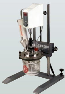
REACTRON® RT 1 (standard) REACTRON® RT 1 (Standard)

Gerne diskutiert unsere Verkaufs- und Anwendungsabteilung mit Ihnen Ihre Homogenisier-, Misch- und Nassmahlaufgaben im Labor-, Pilotanlagen- und Produktionsbereich. Zusammen arbeiten wir Ihnen die feinste Lösung passend zu Ihrer Anwendung aus.