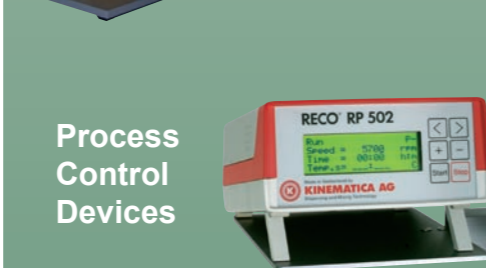
Process Control Devices