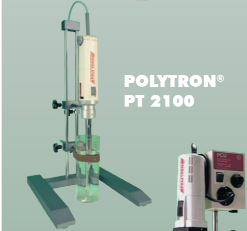
POLYTRON® PT 2100