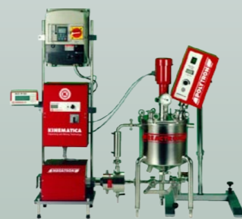
REACTRON® RT 5 (customer specific) REACTRON® RT 5 (Kundenauslegung)