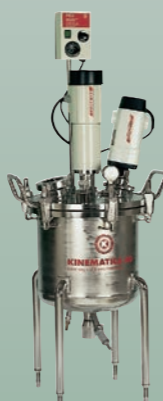
REACTRON® RT 10 (standard) REACTRON® RT 10 (Standard)