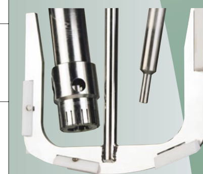
Dispersing Aggregate PTA 30/4G, Anchor stirrer and temperature sensor