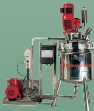
REACTRON® RT 150 (customer specific) REACTRON® RT 150 (Kundenauslegung)