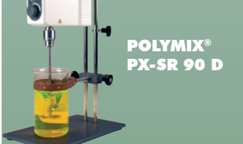
POLYMIX® PX-SR 90 D