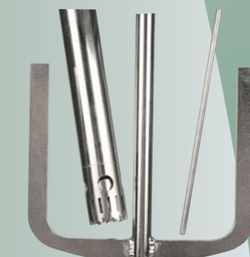
Dispersing Aggregate PT-DA 2120/2G, Anchor stirrer and temperature sensor

Further Info and Accessories on request / Weitere Informationen und Zubehör auf Anfrage