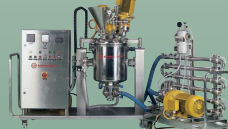
REACTRON® RT 50 (customer specific) REACTRON® RT 50 (Kundenauslegung)